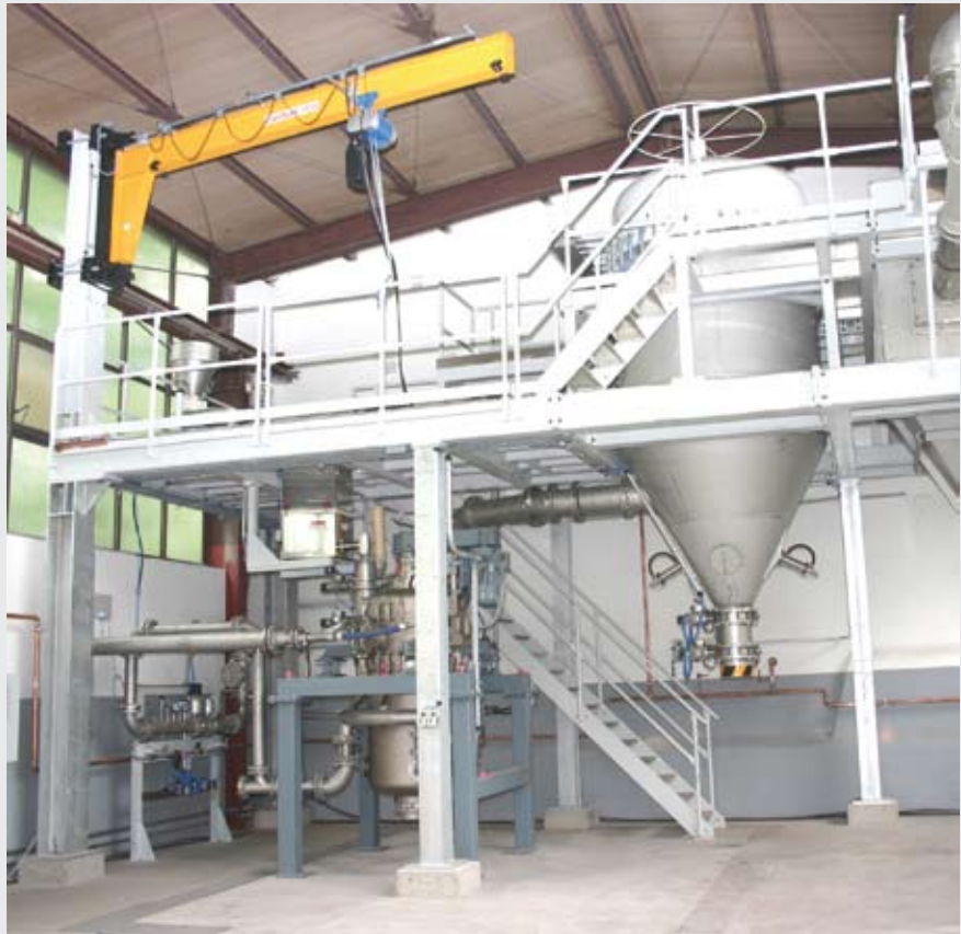
Lohnmahlanlage mit CONDUX Fließbettstrahlmühle Typ CGS 71

Mahlfeinheiten vom Millimeterbereich bis zu 1 \mu\text{m} ( d_{97} ) sind auf unseren verfügbaren Mahlsystemen reproduzierbar darstellbar!